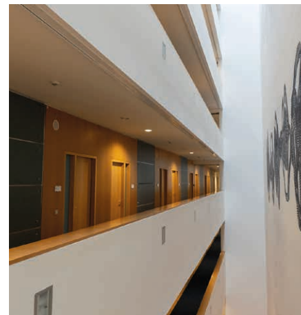
Luftraum im Jakob-Kaiser-Haus mit und ohne selbsttätige „mobile“ Rauchschürze (v. l.).

Um im Brandfall die Rauchausbreitung über alle Stockwerke hinweg zu verhindern, wurden in allen Fluren zum Innenhof Rauchschürzen angebracht. Abgerollt trennen die Rauchschürzen die Flure vom Innenhof und sind damit raumabschließend im Sinne der EN 12101. Entstehender Brandrauch verteilt sich dann nicht in den Fluren, sondern wird zum Glasdach geführt, wo er über die Entrauchungsöffnungen aus dem Gebäude abgeleitet wird. Insgesamt wurden in den 21 bzw. 16 Meter langen Fluren über sieben Stockwerke hinweg 29 einzelne Rauchschürzen verbaut.